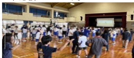
新入生歓迎会でのダンスタイム！

高等部では、校外での就業体験や校外学習、修学旅行などがあります。体調管理をしっかりと行い、ベストな状態で様々な体験をできるといいですね。高等部での日々が、実り多いものになりますように、応援しています。