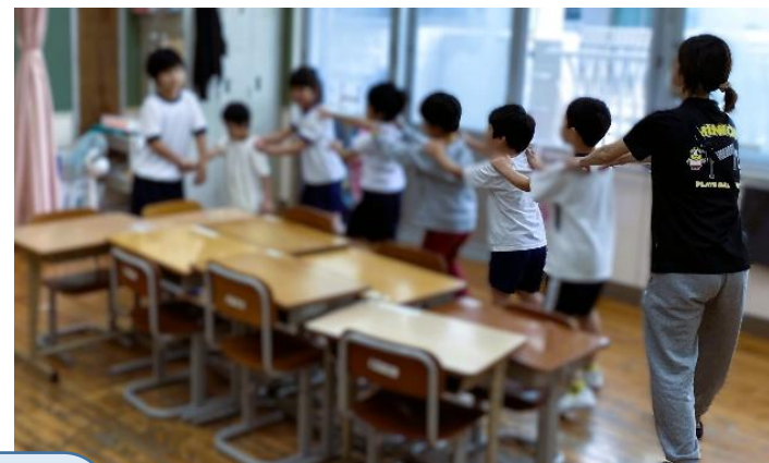
低学年 自立活動「電車ごっこ」 友達とペースを合わせて歩くよ。 (人間関係の形成/環境の把握 ※個に応じて設定)