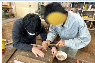
職業科(木材加工)の実習