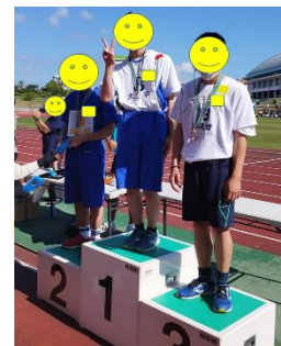
特別支援学校 体育大会