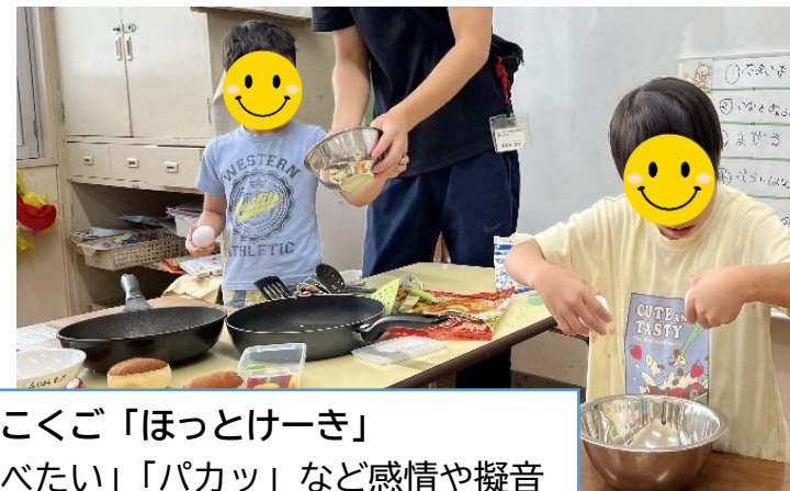
小2こくご「ほっとけーき」 「食べたい」「パカッ」など感情や擬音語を身振りやことばで表現するよ